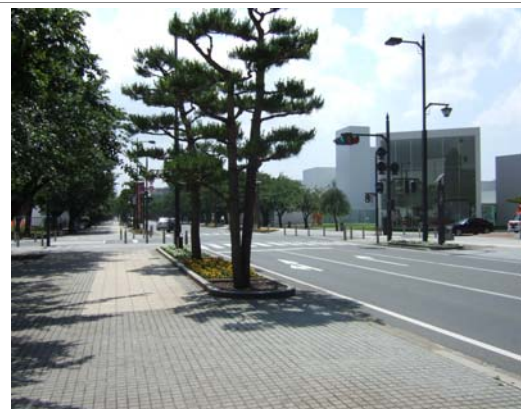
日本の道百選で選ばれた「官庁街通り」と 「十和田市現代美術館」