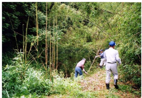
住民参加による造林保育と森林の整備