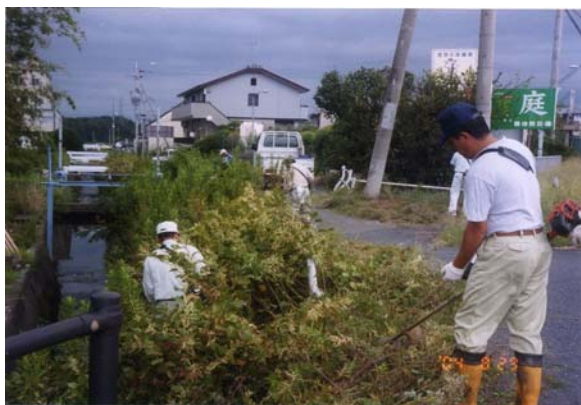
住民参加による河川・水路の清掃活動