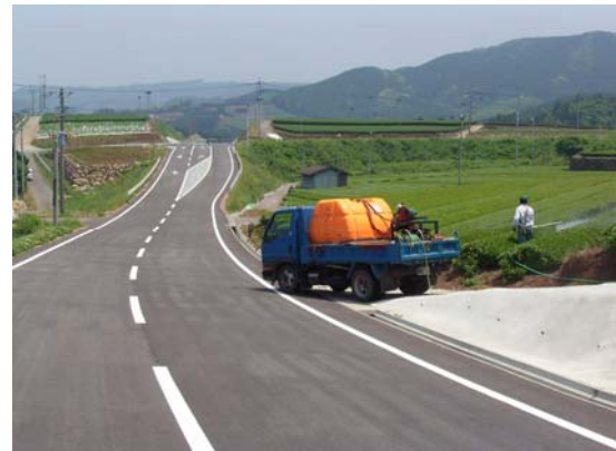
作業効率が向上した広域農道と茶畑