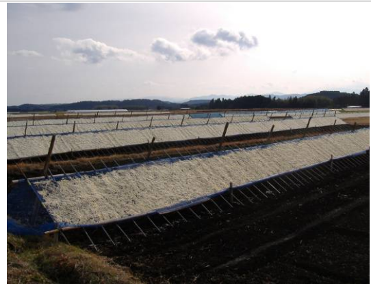
特産品である「せんぎり大根」