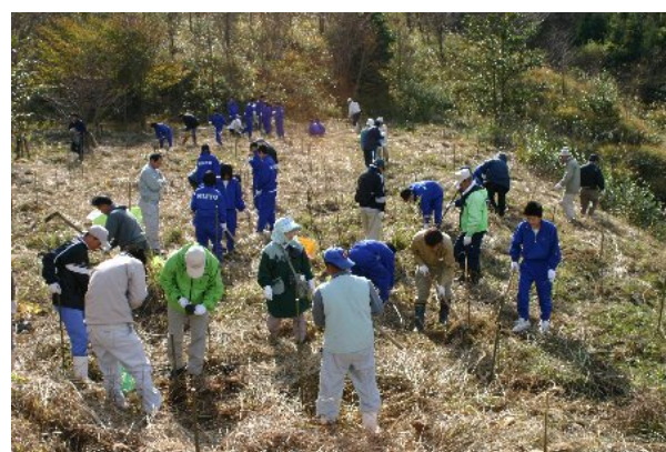
森林ボランティア