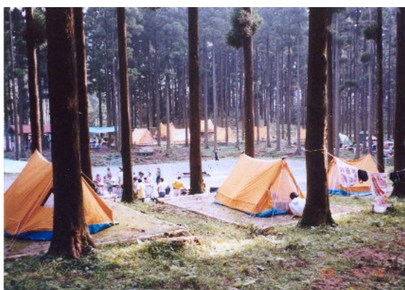
真名子キャンプ場