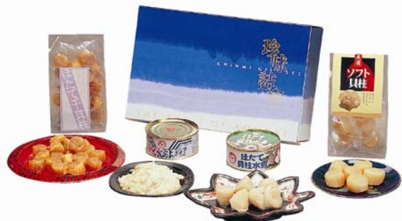
陸奥湾ホタテ加工品