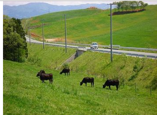
広域農道沿線の放牧風景