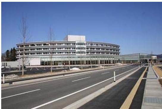
「安心、安全、安寧」の地域医療体制