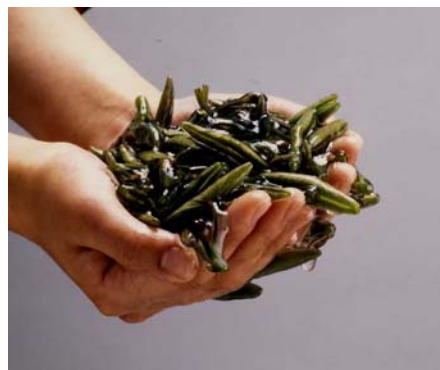
加工後のジュンサイ