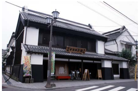
土浦まちかど蔵「大徳」