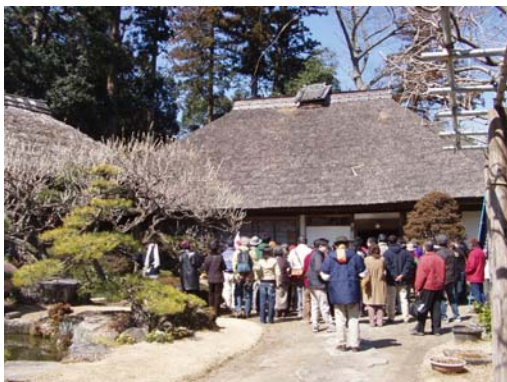
点在する茅葺き民家(石岡市)