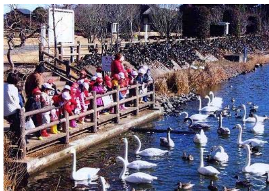
一ノ関ため池親水公園