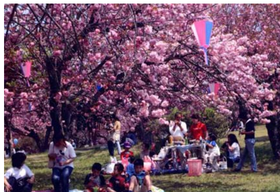
静峰ふるさと公園