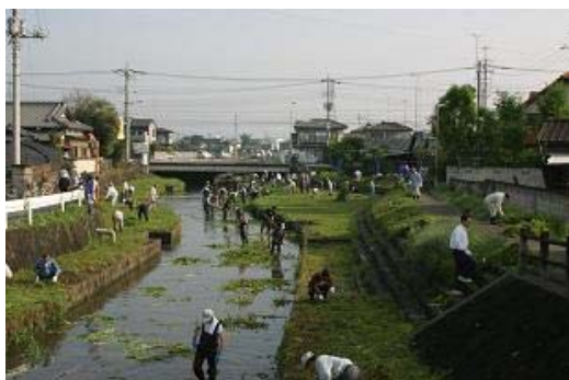
巴波川の一斉清掃の様子