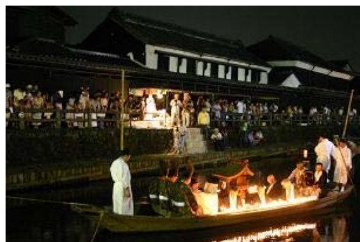
百八灯流し（巴波川）