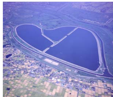
渡良瀬遊水池 谷中湖