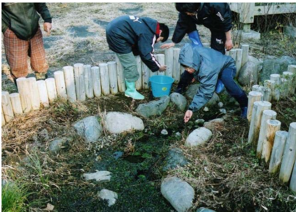
「ほたるの学校」の様子