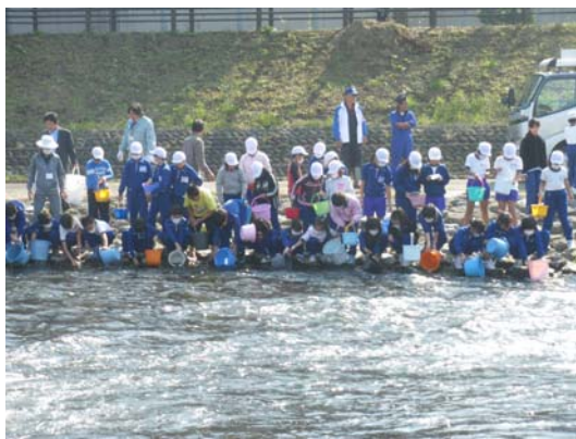
市内小学生による魚の放流