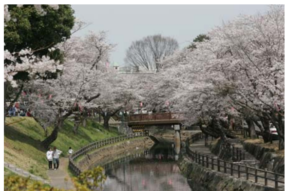
桜の名所 行屋川水辺公園