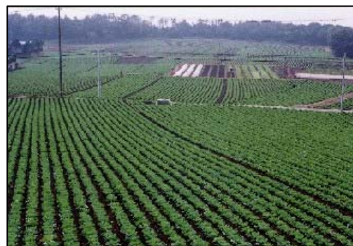
県内随一の農業生産額を誇る東総台地