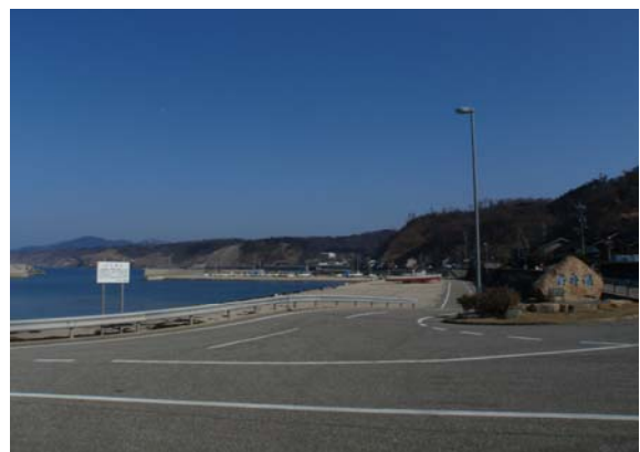
名舟漁港（安定的な出入港の確保）