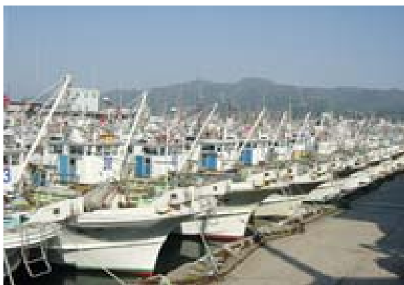
輪島港（拠点市場の強化）