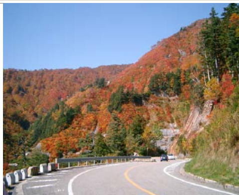
白山スーパー林道の紅葉