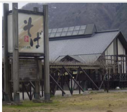
白山麓そば街道（河内地場産業センター）