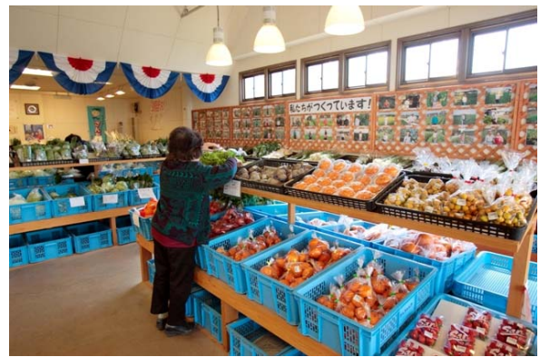
農村体験型交流施設での産直物販