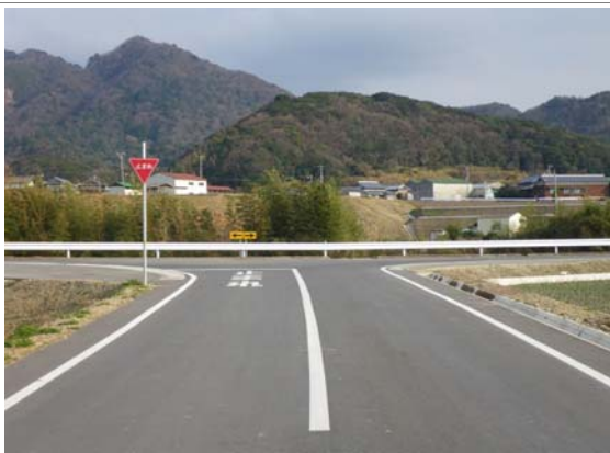
広域農道・市道の一体的な整備