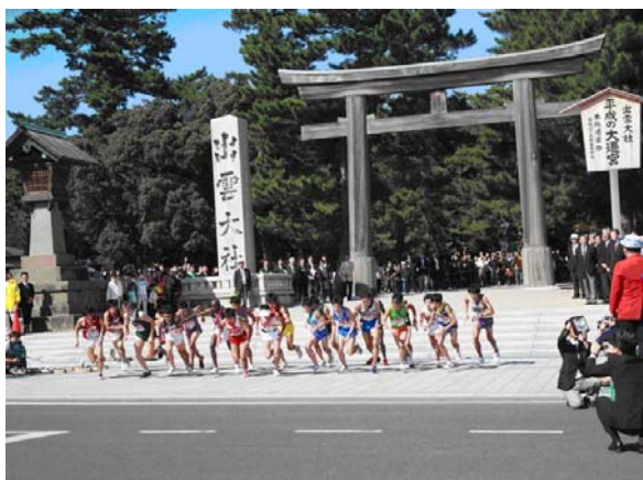
出雲駅伝スタート