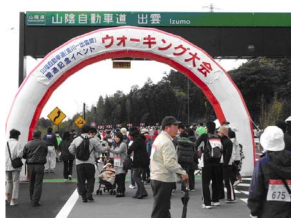
山陰自動車道(斐川～出雲)開通記念イベント