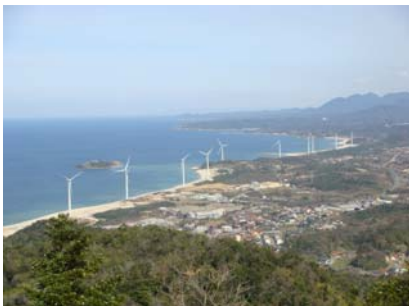
風力発電の風車群