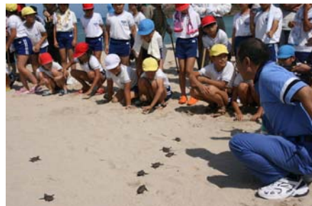
海亀の赤ちゃんを見守る子供たち