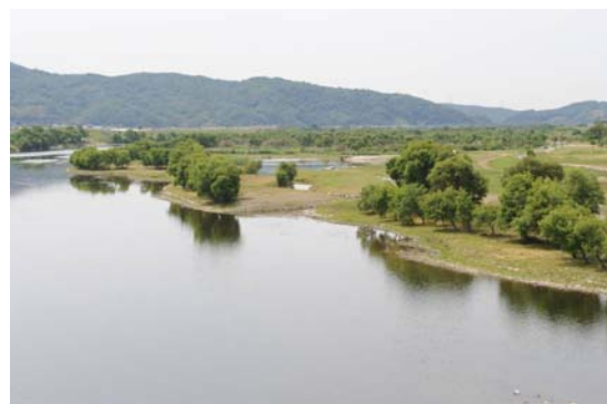
一級河川高梁川の清流