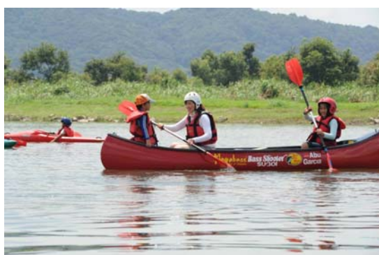
水辺の楽校でのカヌー