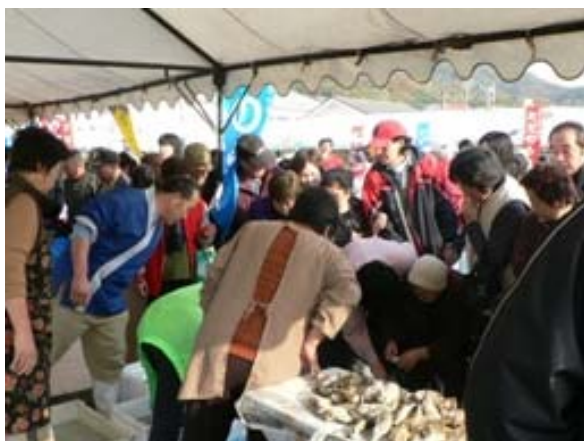
みなとオアシスでのイベントの様子