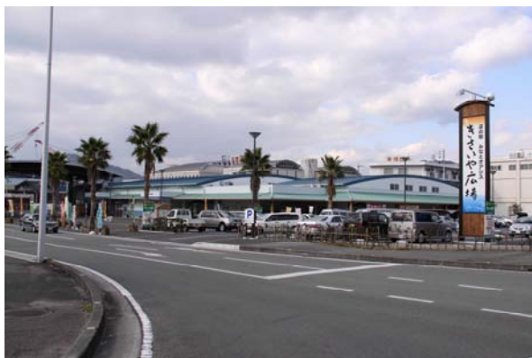
交流拠点施設「きさいや広場」