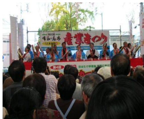
市内商店街、牛鬼すとりーとにて行われる産業まつり