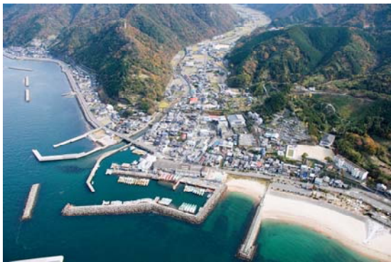
双海町上灘地区商業市街地の全景