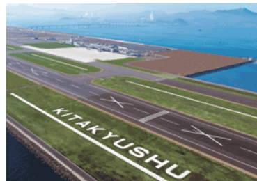
新鮮フライト便 (新北九州空港)