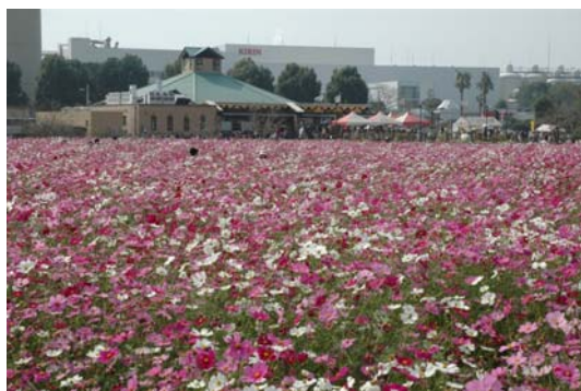
約1000万本が咲き乱れる コスモス園