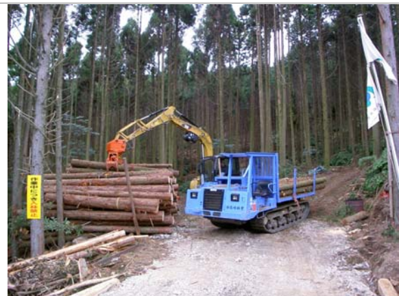
西彼杵半島線搬出状況