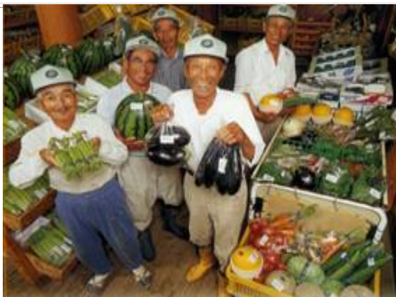
さまざまな農林産物