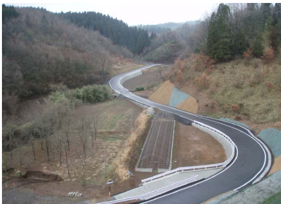
道整備事業（大久保米山線）