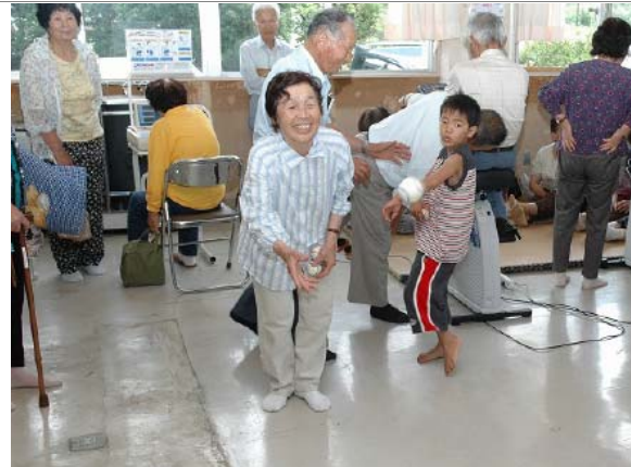
廃校を利用したコミュニティ活動