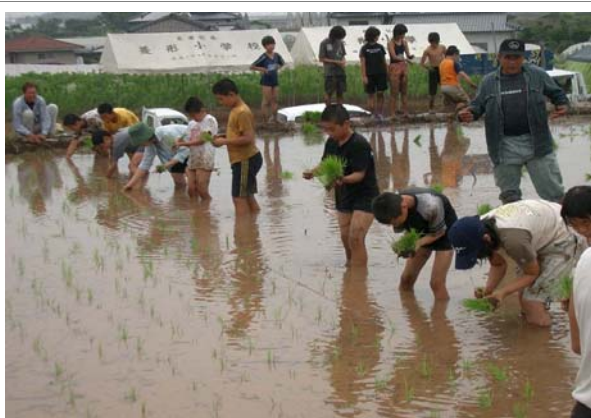
小学生の田植え体験