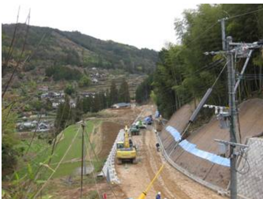
建設中の市道湯山線