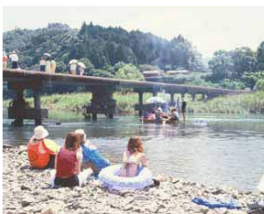
清流北川で憩う人々