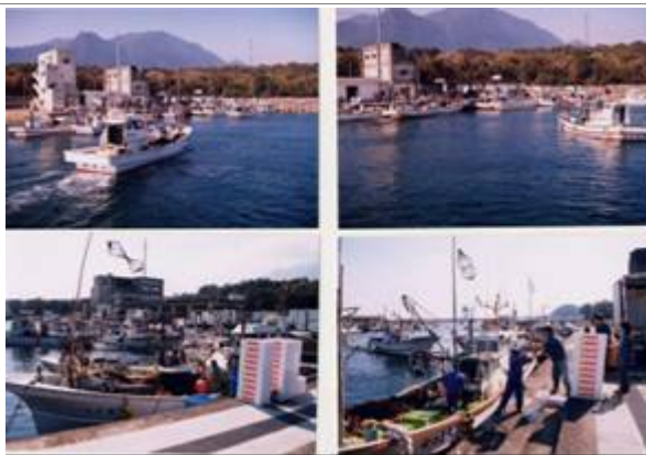
安房港 水揚げ状況