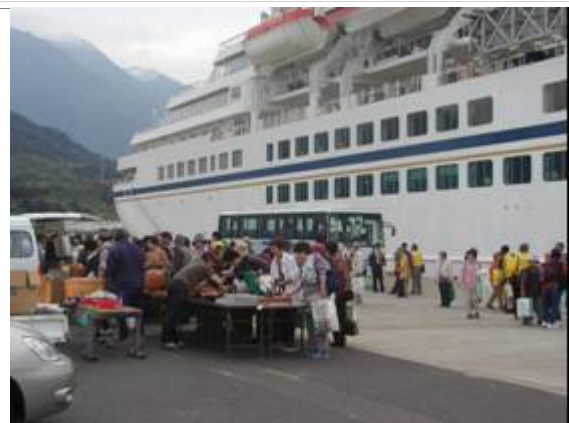
宮之浦港 観光船寄港