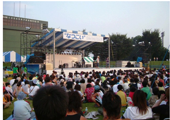
夏のイベント“なつこい”