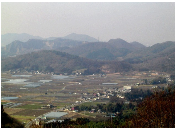
太平山県立自然公園