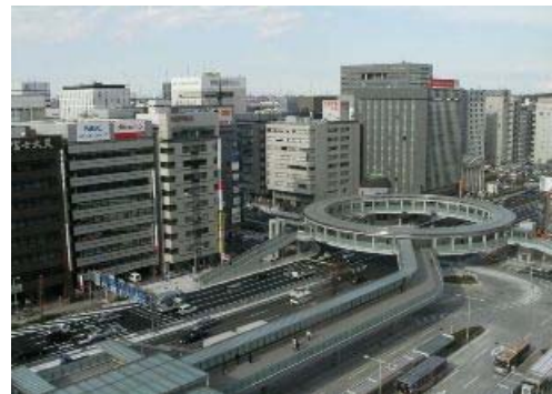
IT企業が集積する新横浜駅周辺地域