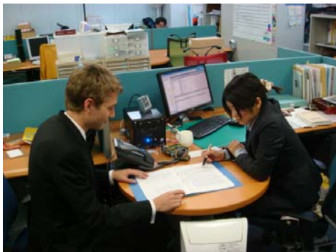
認定事業者の業務風景