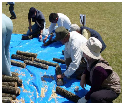
人と林産物の活性化「椎茸の原木植菌体験」