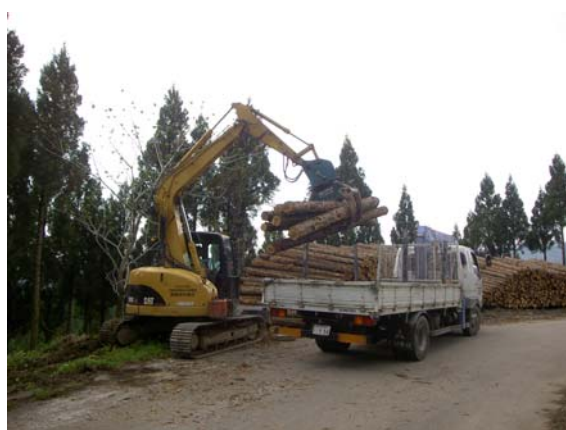
間伐木材の利用増