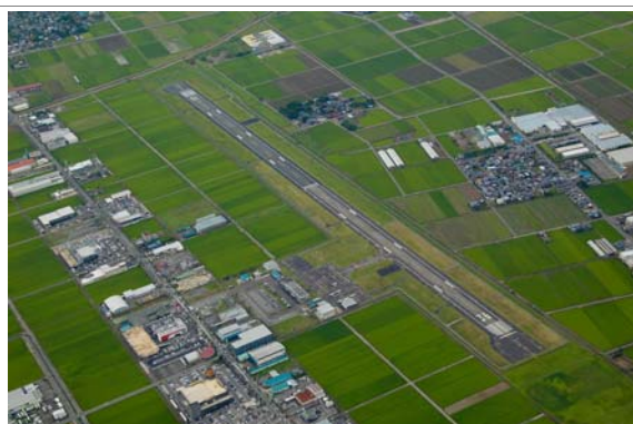
坂井地区（福井空港周辺）

・ 公有地の拡大の推進に関する法律による先買いに係る土地を供することができる用途の範囲の拡大