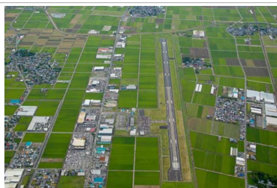
田園と商業地域の共存