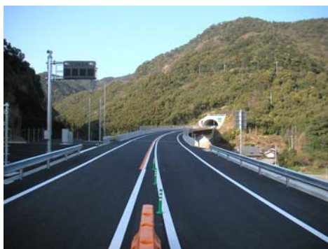
四国横断自動車道の一部・宇和島道路