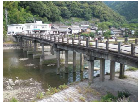
宇和島市内の老朽橋梁（架設後 90 年）