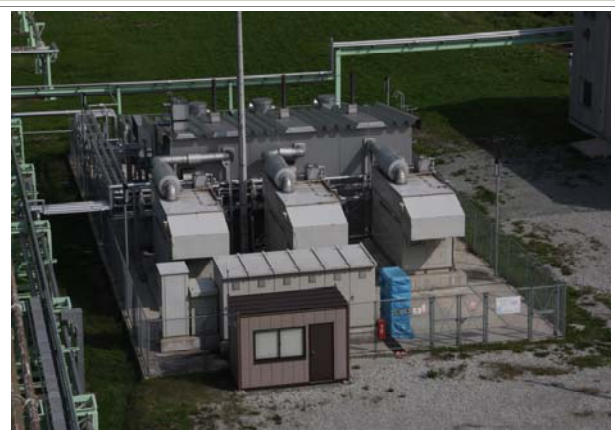
バイオガスエンジン 170kw×3台