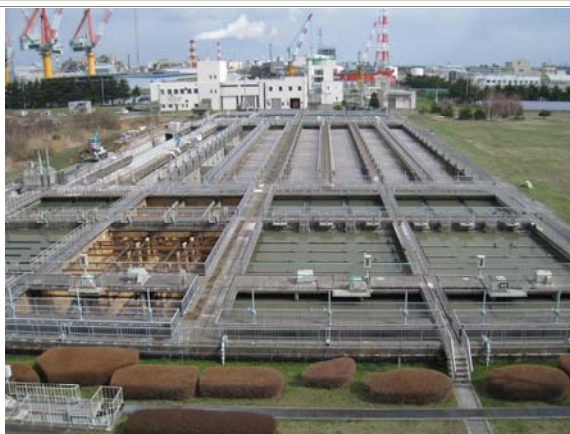
八戸市東部終末処理場全景