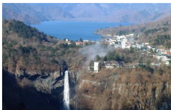
日光国立公園（中禅寺湖、華嚴の滝）