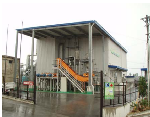
バイオマスエタノールプラント