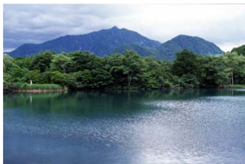
白池から見た雨飾山