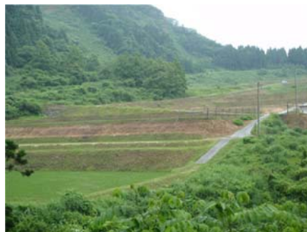
広域農道の整備により 農産物流の効率化を図る