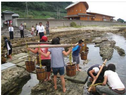
塩田村の塩づくり体験