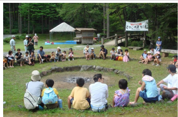
県民の森「むかし体験」