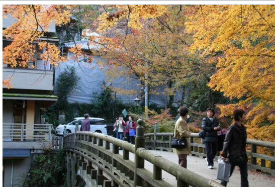
山中温泉「こおろぎ橋」