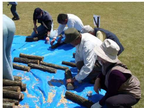
人と林産物の活性化「椎茸の原木植菌体験」