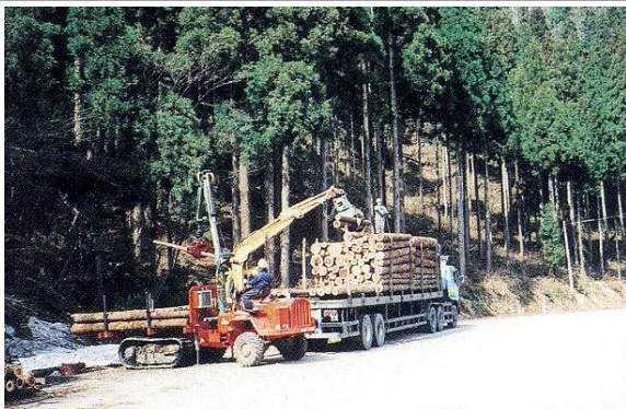
人と林産物の活性化「森林施業の状況」