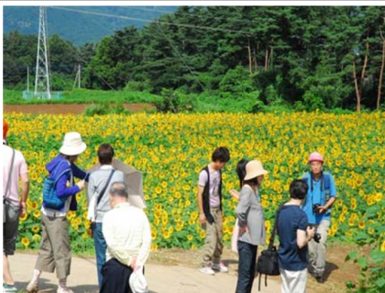
明野サンフラワーフェス会場