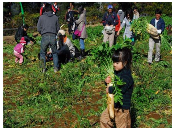
浅尾ダイコンまつり