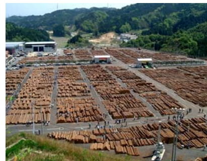
林業の流通拠点施設 「ウッドピア松坂」