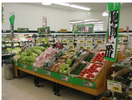
「みえ地物一番の日」 キャンペーンの様子