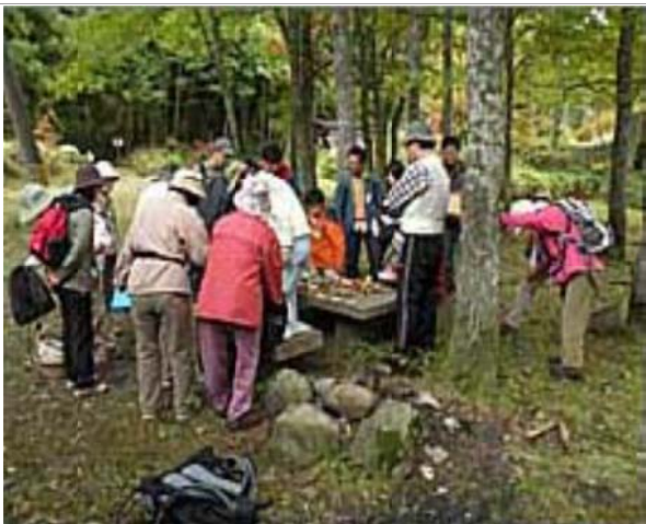
北広島町内のキャンプ場施設