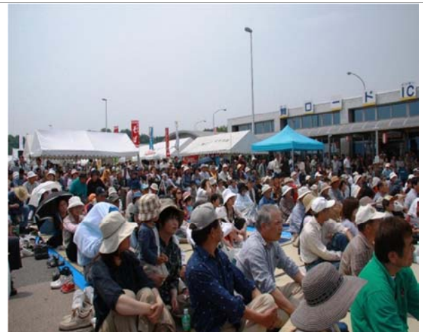
道の駅「舞ロード I C 千代田」