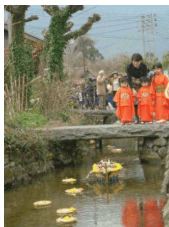
水辺・ふれあい・歴史