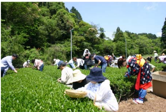
ひがしそのぎ茶摘み体験バスツアー