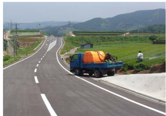
作業効率が向上した広域農道と茶畑